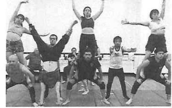
Convivencia y ensayo de la obra