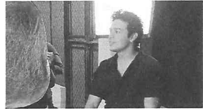
Sesión fotográfica para publicidad