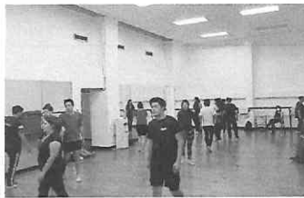
Entrenamiento de ritmo