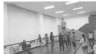
Ejercicios de confianza y ensayo