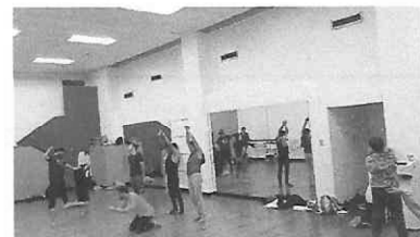
Ensayo de la obra