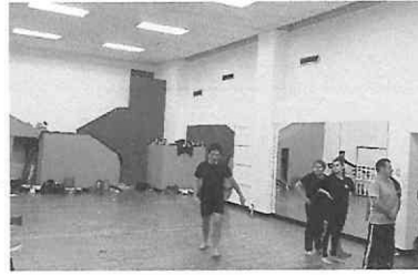
Ensayo de la obra