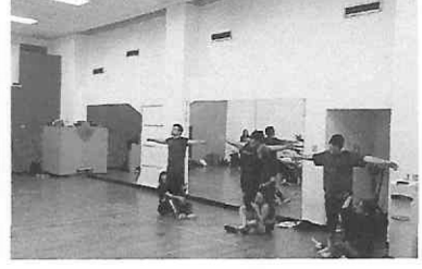
Ensayo y montaje de la obra