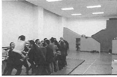
Ejercicio de confianza