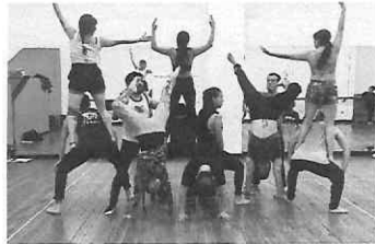
Coordinación y figura