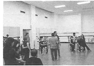
Lectura y análisis