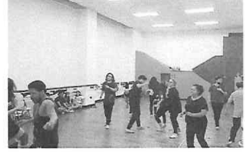
Ensayo de la obra últimas escenas