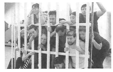
Ensayo de la obra