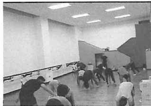
Ejercicios de resistenci